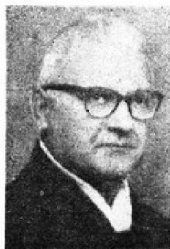
O. ZLATAN PLENKOVIĆ